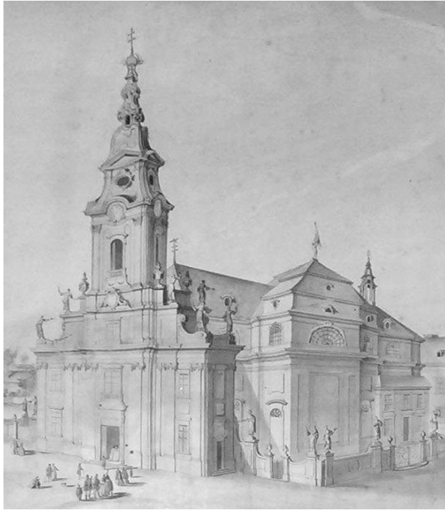
3. Rosenstingl rajza az építendő piarista templomról