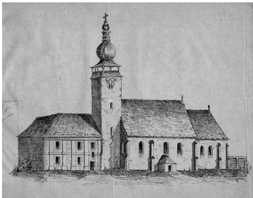
2. Mindenszentek plébániatemplom és az első piarista rendház délnyugati sarka( XVIII. sz., készítője ismeretlen)