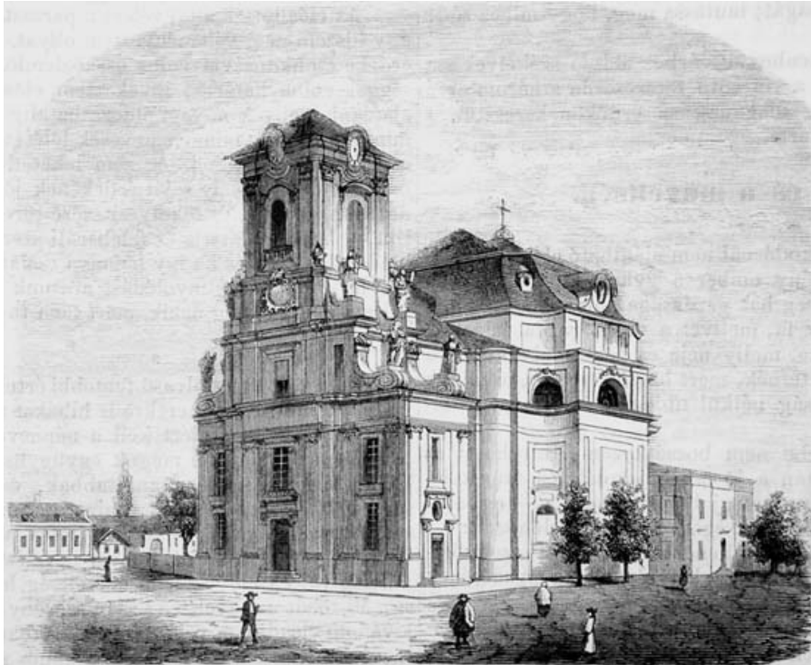
3. A Nagykarolyi katolikus templom 1857-ben (In: „ Vasárnapi Újság ”, Budapest, IV-1857. 26 szám.)