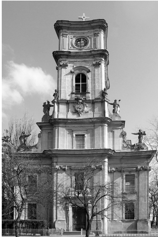
4. A templom homlokzata napjainkban